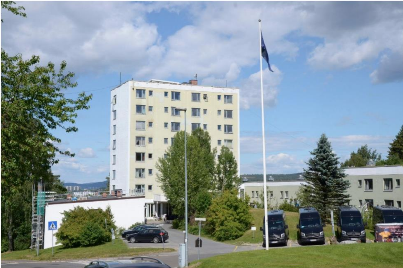
SKAL RIVES: Institusjonen i Marmorveien 2.